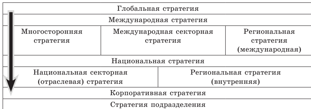
Рис. 2. Система стратегий согласно теории В. Л. Квинта Fig. 2. The system of strategies according to the theory of V. L. Kvint

приоритетов является инновационное развитие экономики, которое обеспечивает переход к инновационной модели развития [12, с. 30].