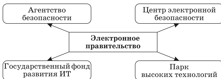
Рис. 2. Инфраструктура развития концепции ЭП Азербайджана Fig. 2. Infrastructure of development of the concept of the e-Government of Azerbaijan