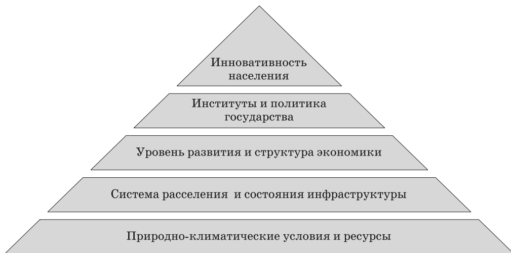
Рис. 1. Пирамида факторов регионального развития Fig. 1. Pyramid of regional development factors

ляется наличие конкурентного преимущества, это позволяет ускорить экономический рост, привлечь инвестиции, концентрировать высококвалифицированные трудовые ресурсы. Формирование конкурентного преимущества зависит от определенной среды и условий внутри региона. В рамках своей работы «Пирамида факторов социально-экономического развития регионов» [3, с. 125] д. э. н. О. В. Кузнецова предлагает концепцию формирования иерархичной системы факторов экономического и социального развития региона по принципу пирамиды Маслоу (рис. 1).