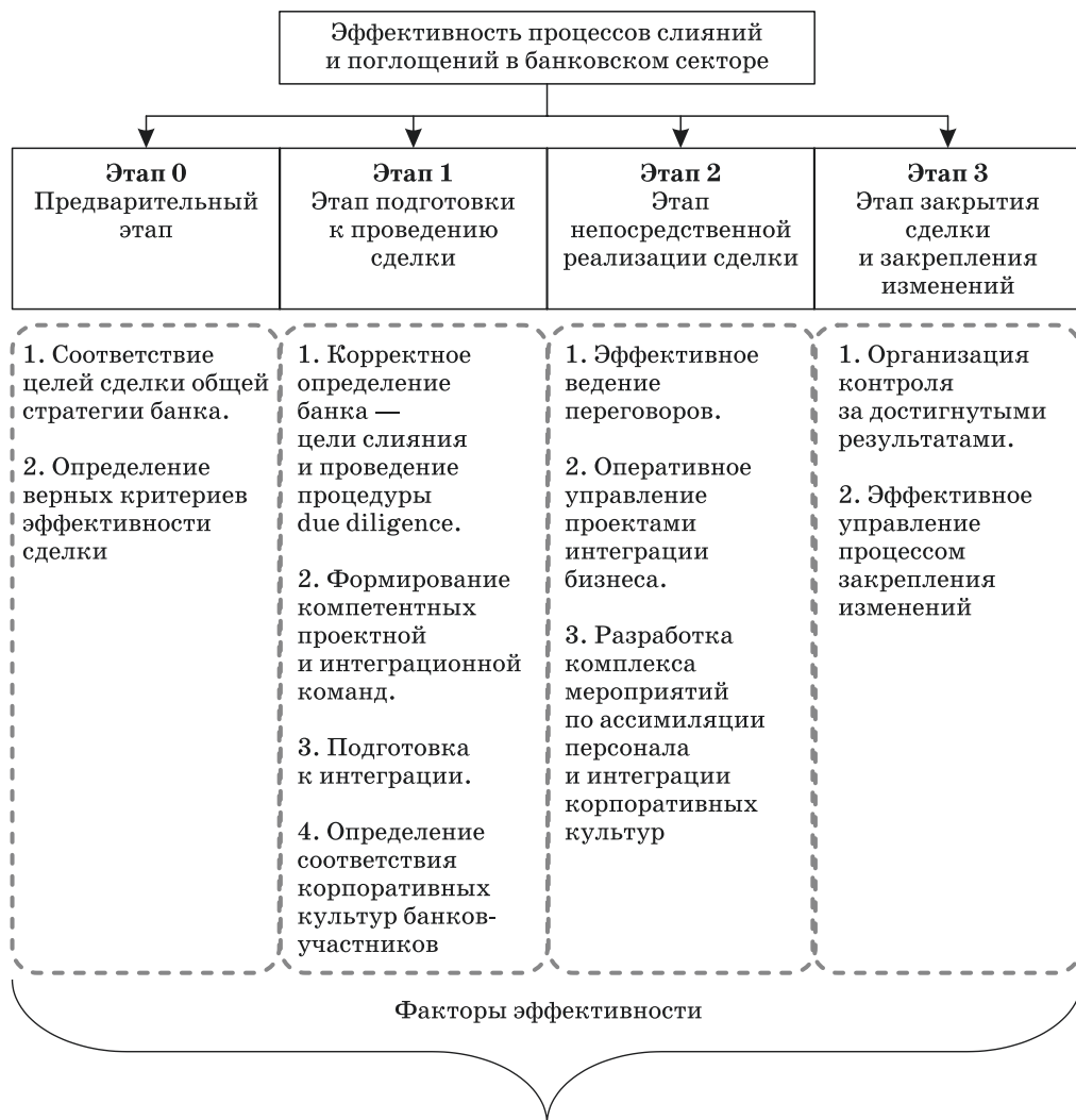
Рис. 1. Факторы эффективности сделки слияния и поглощения в банковском секторе Fig. 1. Factors of efficiency of the transaction of merge and absorption in the banking sector