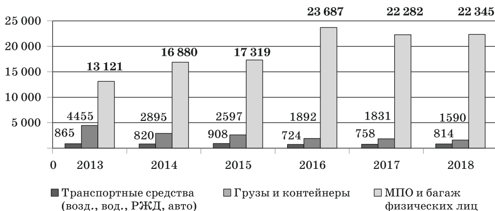
Рис. 2. Обследованные объекты кинологами в период с 2013 по 2018 г. (тыс. ед.)