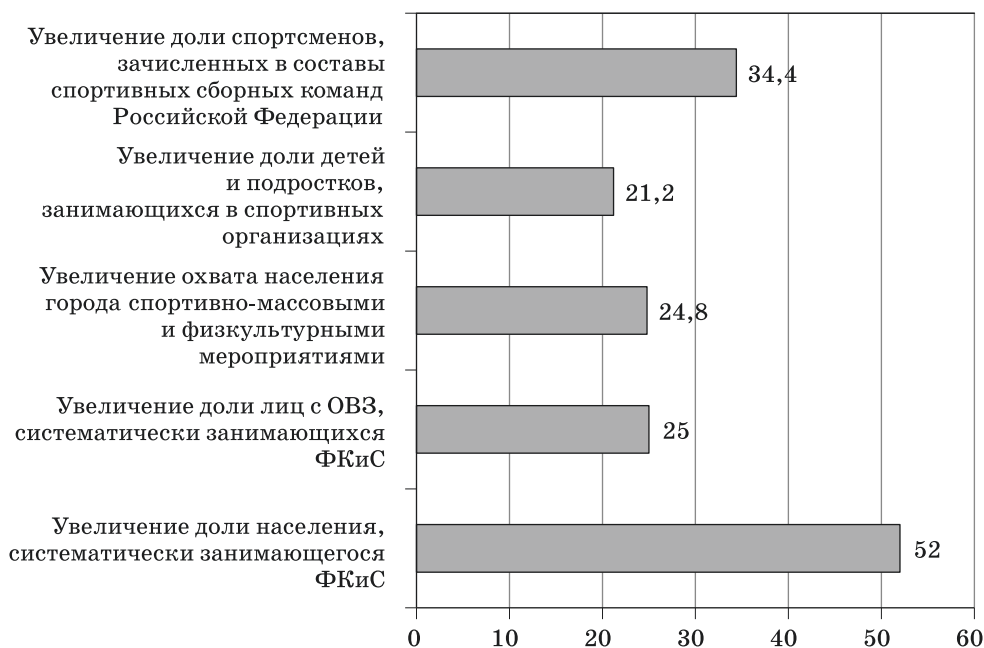
Рис. 2. Ожидаемые результаты реализации государственной программы, % Fig. 2. The expected results of implementation of the state program, %