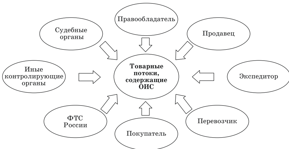
Рис. 2. Международная цепь поставки товаров, содержащих ОИС (субъектный подход) Fig. 2. The international chain of delivery of the goods supporting intellectual property items (subject approach)

сути — весь механизм и представленная на рис. 1 круговая схема начинается именно с правообладателя (или его законного представителя). Дальнейший порядок действий подробно описан в Таможенном кодексе ЕАЭС 1 (гл. 52) и Федеральном законе № 289-ФЗ 2 .