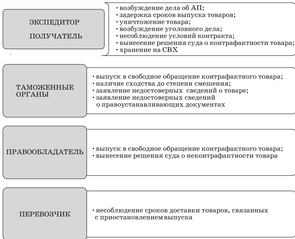
Рис. 4. Риски субъектов международной цепи поставок товаров, содержащих ОИС Fig. 4. Risks of subjects of the international chain of deliveries of the goods containing intellectual property items

работать целую программу, направленную на их минимизацию (например, получатель товара).