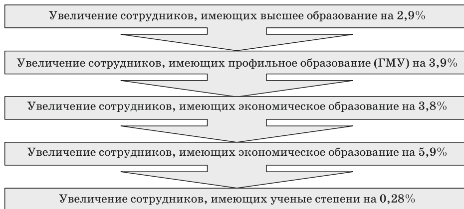
Рис. 3. Тенденции в изменении качественного состава государственных гражданских и муниципальных служащих Владимирской области в 2013–2016 гг. относительно приоритетных направлений высшего профессионального образования Fig. 3. Trends in change of qualitative list of the state civil and municipal servants of the Vladimir region in 2013–2016 concerning priority directions of higher education

ципального управления должны соответствовать наиболее высоким требованиям по сравнению с предыдущими поколениями кадрового состава администрации Владимирской области. Российское общество стремится быть ценностно-ориентированным. Представители государственного управления должны быть первоочередными носителями гуманистических ценностей современного общества [7, с. 16]. В связи с этим современные государственные гражданские и муниципальные служащие нуждаются в быстром и безболезненном для личного опыта и профессиональной деятельности заполнении существующих лагун, среди которых можно назвать: недостаток жизненного опыта, несоответствие образования профессиональной деятельности, недостаток профессионального опыта и др.