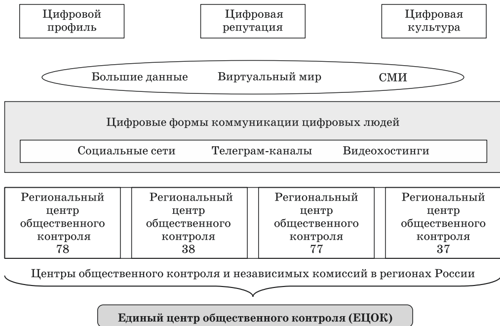
Рис. 1. Модель цифровой коммуникации с единым центром общественного контроля Fig. 1. Digital communication model with a single center of public control

надо создавать Центры общественного контроля за движением бюджетных средств. Цифровизация — программа всего общества. Региональные центры общественного контроля и независимых проверок повысят дисциплину и позволят минимизировать риски возникновения протестных движений в обществе (рис. 1).