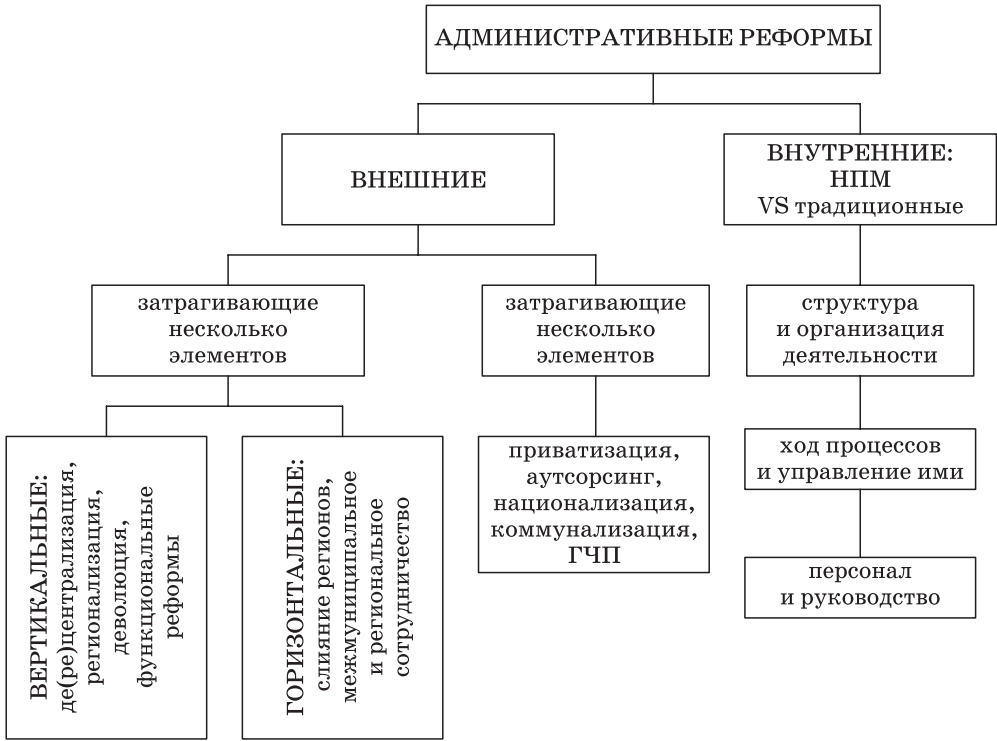
Рис. 1. Типология административных реформ (выполнен автором)

делить сферу деятельности государства (ограничить ее), усилить рыночные механизмы, стимулировать конкуренцию и укрепить позиции гражданина как клиента в сфере государственных услуг. Это направление главного удара, с аналитической точки зрения, может быть определено как макроизмерение в рамках модели НПМ [33, с. 79]. С другой стороны, в ходе процесса внедрения экономических стимулов, применения производственно-экономических ноу-хау, демонтажа иерархических структур и четкого разделения функций и ролей между политикой и административной деятельностью должны были быть перестроены многие элементы административных систем: внутренняя структура, принципы организации и характеристики персонала публичного управления в соответствии с образом «государства-менеджера» (managerial state), вдохновленным, прежде всего, микроэкономическими категориями. Этот комплекс мероприятий может быть определен как внутрискруктурное микроизмерение в рамках НПМ (там же). В обобщенном виде данная модернизация может быть представлена в следующем виде (рис. 2).