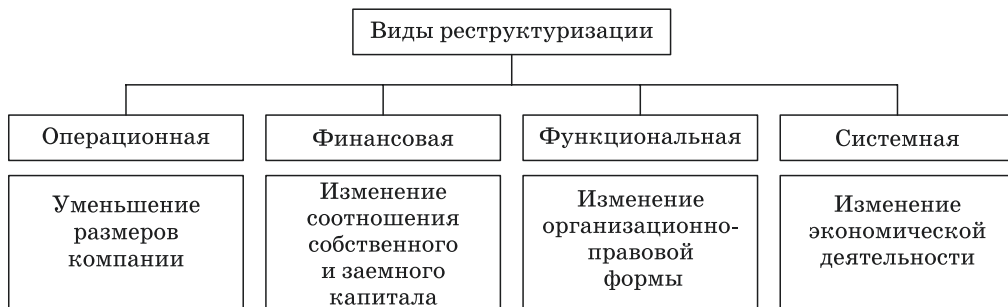
Рис. 1. Виды и характеристики реструктуризации Fig. 1. Types and characteristics of restructuring